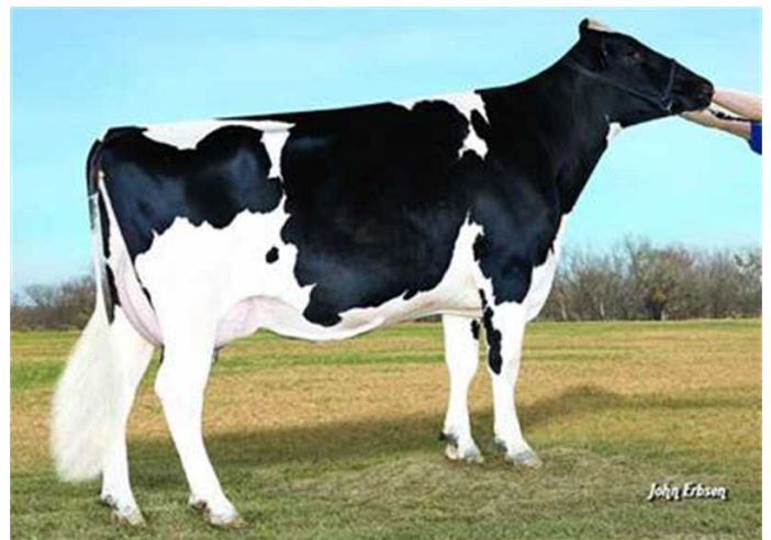
Roylane Shot Mindy 2079-ET - 8. gen. M